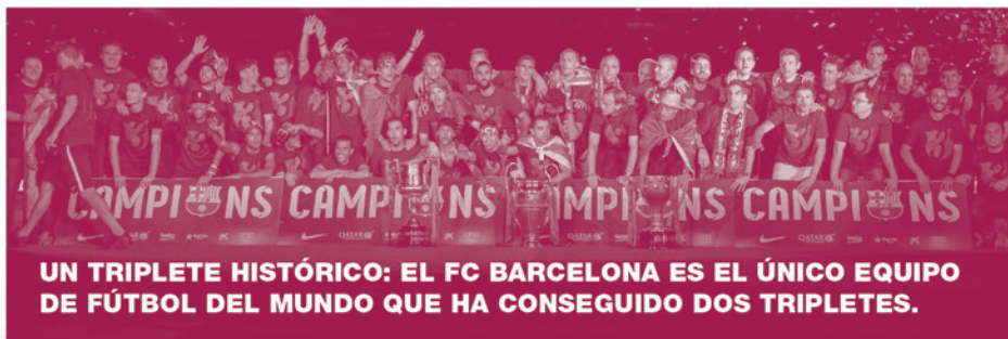
UN TRIPLETE HISTÓRICO: EL FC BARCELONA ES EL ÚNICO EQUIPO DE FÚTBOL DEL MUNDO QUE HA CONSEGUIDO DOS TRIPLETES.

CONFIAMOS EN LA CANTERA. 12 JUGADORES DE LA MASIA HAN SUBIDO AL PRIMER EQUIPO.